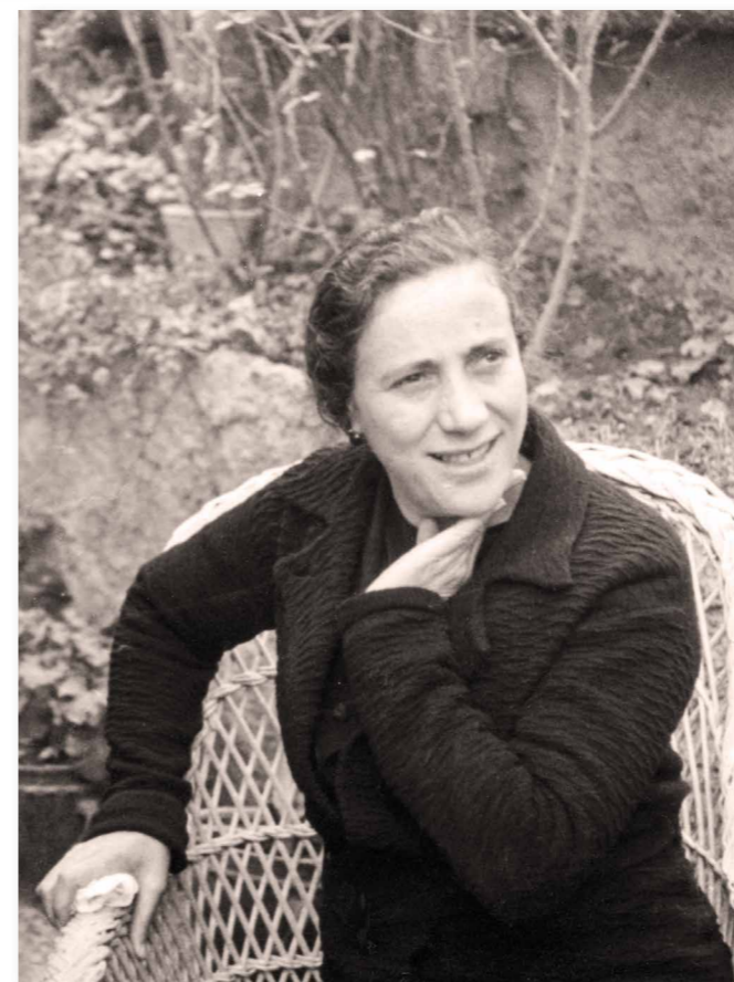
Fundadora del Instituto Secular "Operarias Parroquiales" Pionera del laicado consagrado