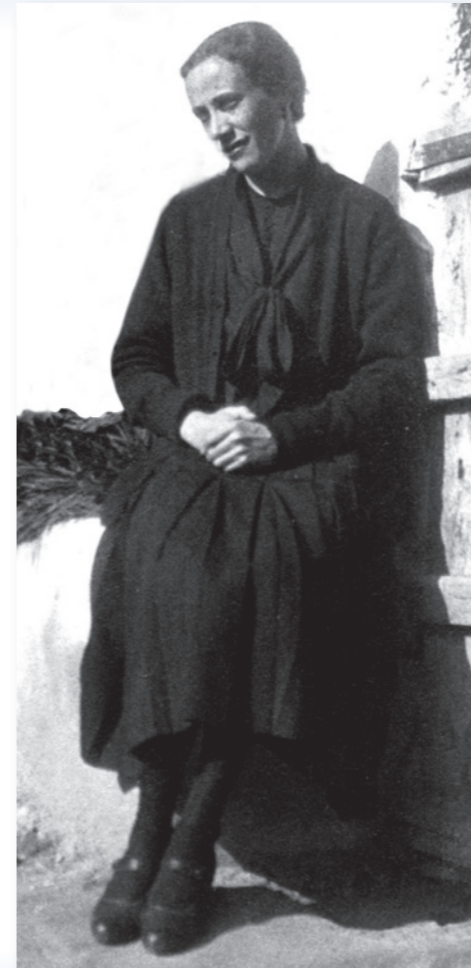
Fondatrice dell'Istituto Secolare "Operaie Parrocchiali" Pioniera del laicato consacrato